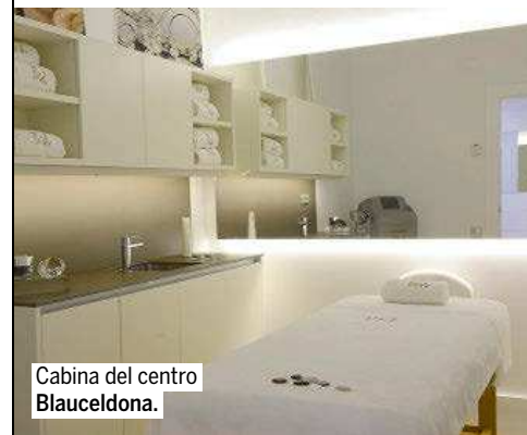
Cabina del centro Blauceldona.

La experta en tratamientos faciales abrió Blauceldona, su instituto de belleza en Barcelona, hace 20 años. Ahora está a punto de inaugurar el segundo. Su labor se ha reconocido con el Premio Hit Salón al mejor centro de estética de España y en 2017 fue premiada con la Estrella de Oro a la Excelencia Profesional.