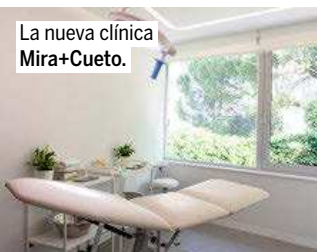
La nueva clínica Mira+Cueto.

cumple 35 años es conseguir que sea la primera española certificada por el Environmental Working Group (EWG), organismo que se dedica a la protección del medio ambiente.